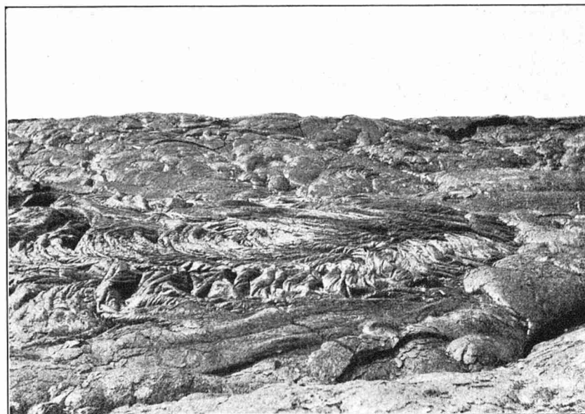
Abbild. 6. Pahoehoe-feld im Kilauea-krater.