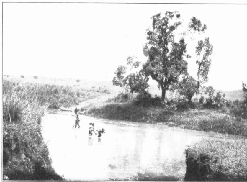
Abbild 15. Übergang über den Taram-Fluss bei Banjo. Typische Adamaua-Landschaft. Hohe Lateritufer. (16. 6. 08.)