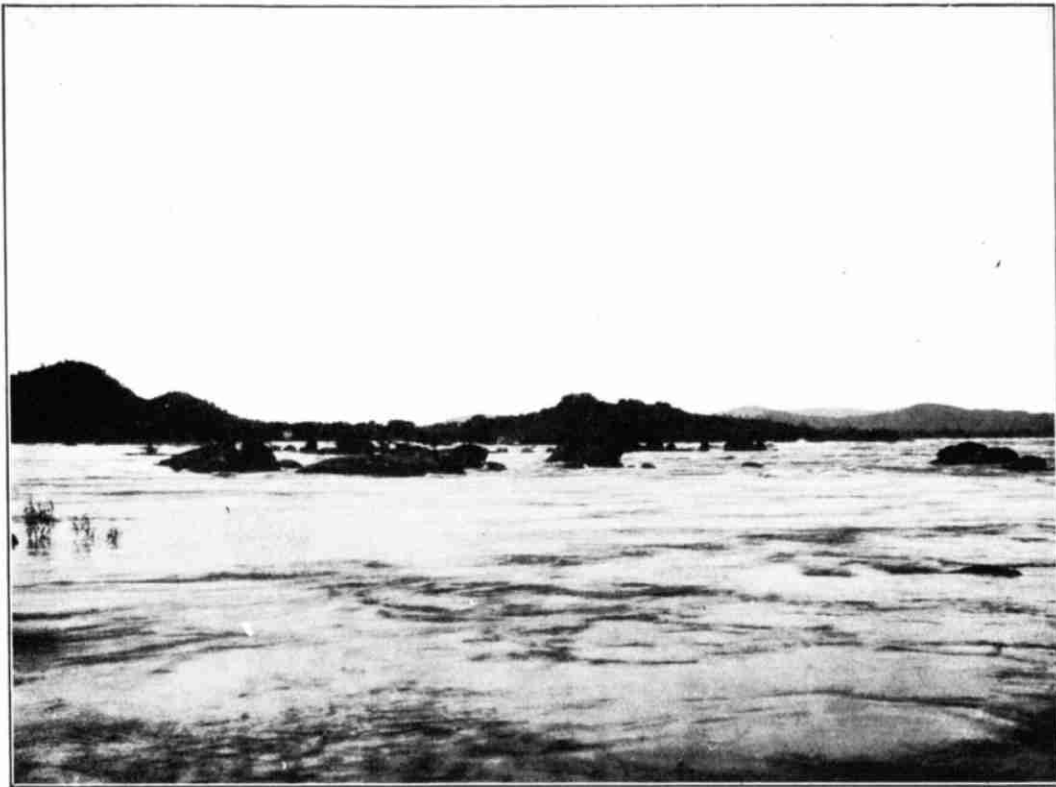
Abbild. 18. Die Stromschnellen von Maipures.