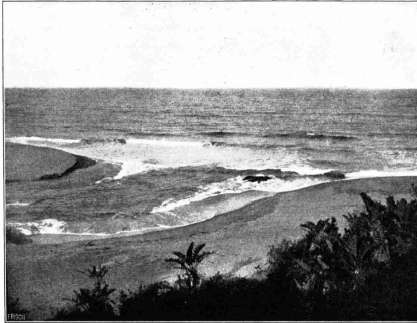
Abbild. 1. Illovo-Mündung, drei Tage nachdem der Flufs den ihn vom Meere abschließenden Sandriegel durchbrochen hatte.