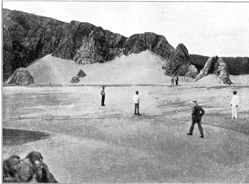
Abbild. 34. Am Strand bei Salina Cruz, unterhalb des Leuchtturms. Mikrogranitfelsen des Morro de Salinas, mit von den Südwinden bis zu etwa 40 m Höhe aufgewehtem Sand.