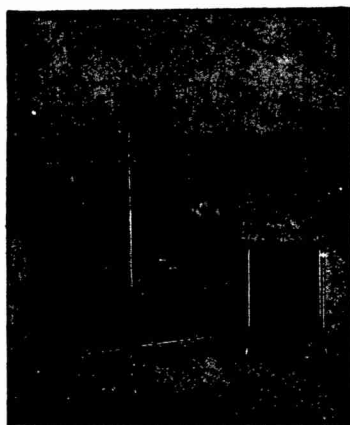
Röntgeneinrichtung mit Gluhkathoden-Röhre für Diagnostik