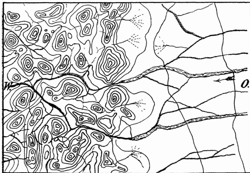
Fig. 34. Hügelgruppe o. s. ö. Guanaco. Maßstab ca. 1:10000. schwarz: Formenlinien (nicht Höhenlinien). blau: Trockentäler.

— Formenlinien (nicht Höhenlinien). - - - - - Wasserscheide der Hügelgruppe gegen die von Osten andrängende Pampa. blau: Trockentäler.